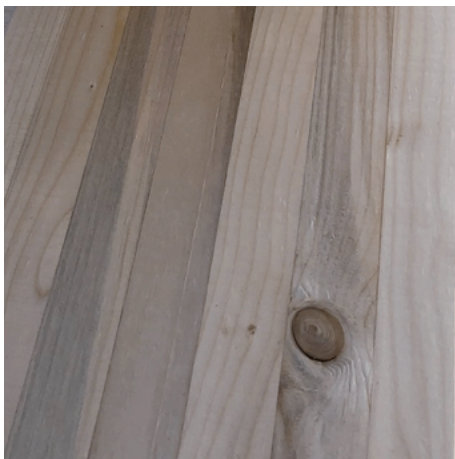
Année 0 (chantier)