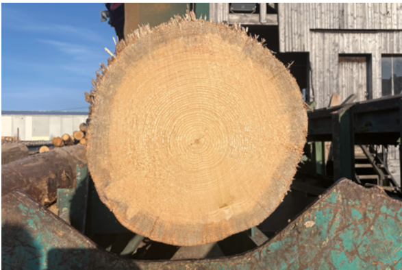
Grume de bois lors de sa récolte :