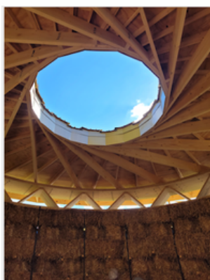
Pavillons Archi-folies portés par le ministère de la Culture et les écoles d'architecture en cours de montage à la Villette