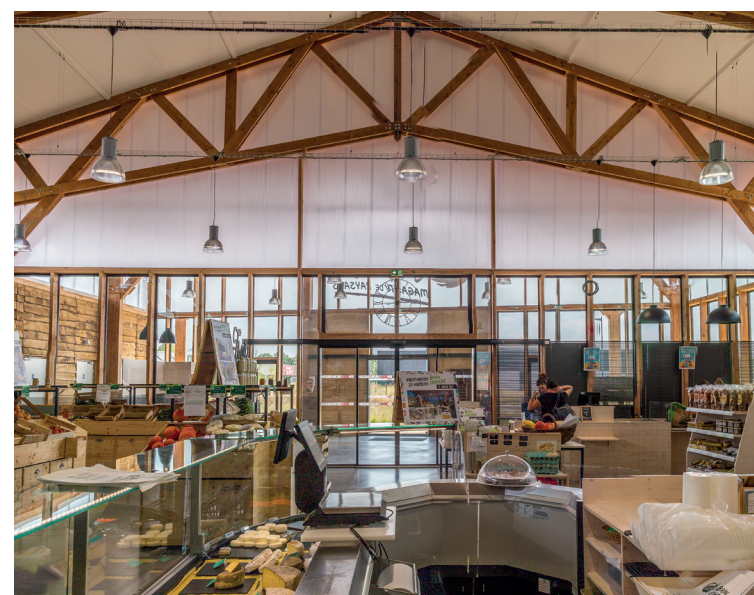
Les ateliers du gué - Bérengère Sadowiczzyk architecte.